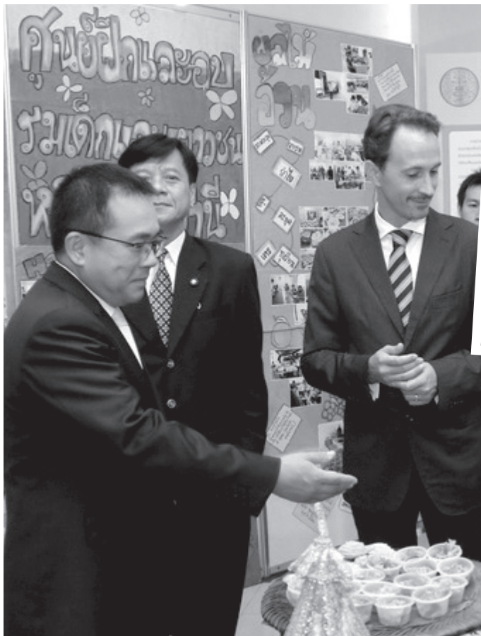
ศ. (พิเศษ) วิศิษฐ์ วิศิษฐ์สรอรรถ อธิบดีกรมพินิจและคุ้มครองเด็กและเยาวชน นำผู้แทน UNICEF เยี่ยมชมการจัดแสดงนิทรรศการทักษะของเด็กและเยาวชน และสินค้าของศูนย์จำหน่ายผลิตภัณฑ์ฝีมือเด็กและเยาวชน (DJOP CENTER)